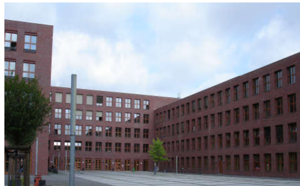
Schulgebäude der Wilhelm – Ostwald – Schule

Nach dem Besuch der dreijährigen Berufsfachschule erwerben Sie zudem den Titel „Staatlich geprüfte/r Assistent/in für Gestaltungstechnik“ und können im Bereich Werbetechnik, Bühne, Restauration oder Dekoration beschäftigt werden.