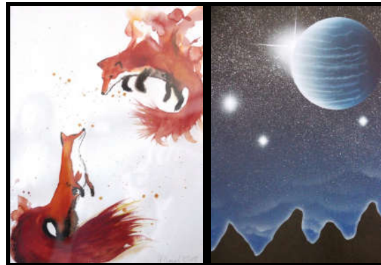
Beispiele aus Wahlpflichtkursen