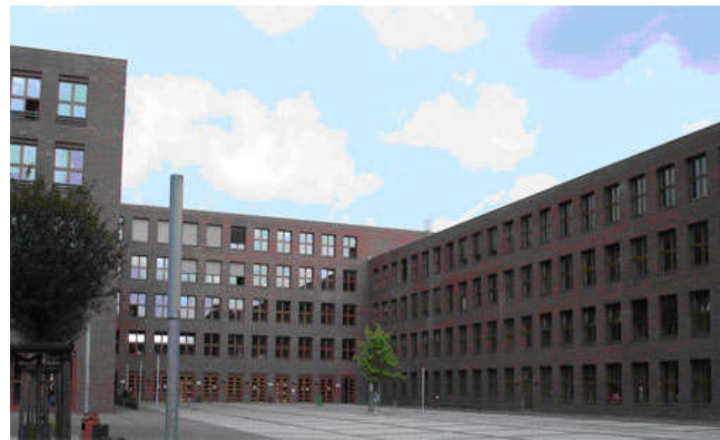
Schulgebäude der Wilhelm – Ostwald – Schule

Nach Besuch der dreijährigen Berufsfachschule erwerben Sie zudem den Titel „Staatlich geprüfte/r Assistent/in für Gestaltungstechnik“ und können im Bereich Werbetechnik, Bühne, Restauration oder Dekoration berufstätig werden.